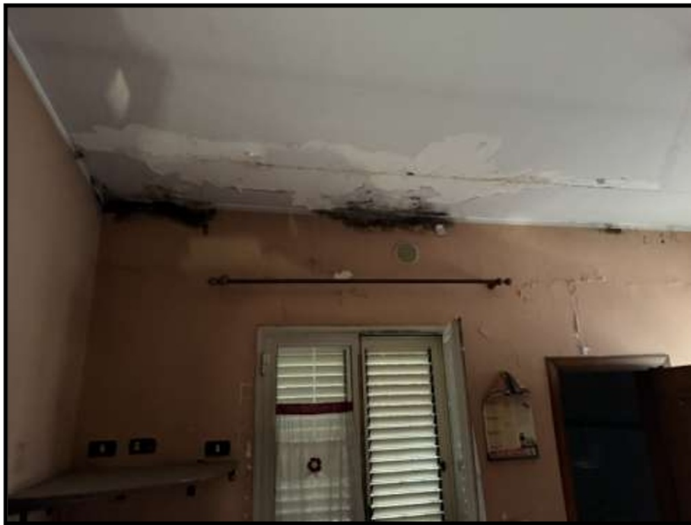
Vano al Piano Primo lato via Schifani