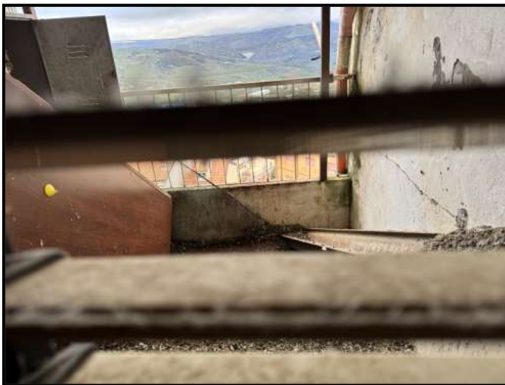
Vano al Piano Primo lato via Schifani – Terrazza Via Schifani