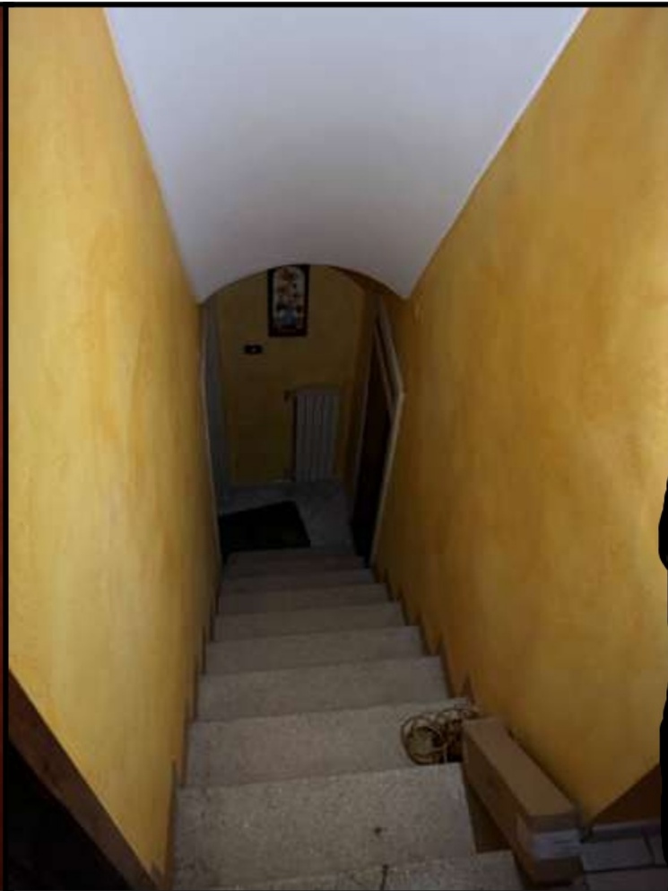
Scala al piano inferiore