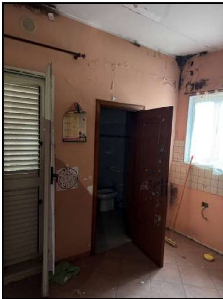
Vano al Piano Primo lato via Schifani