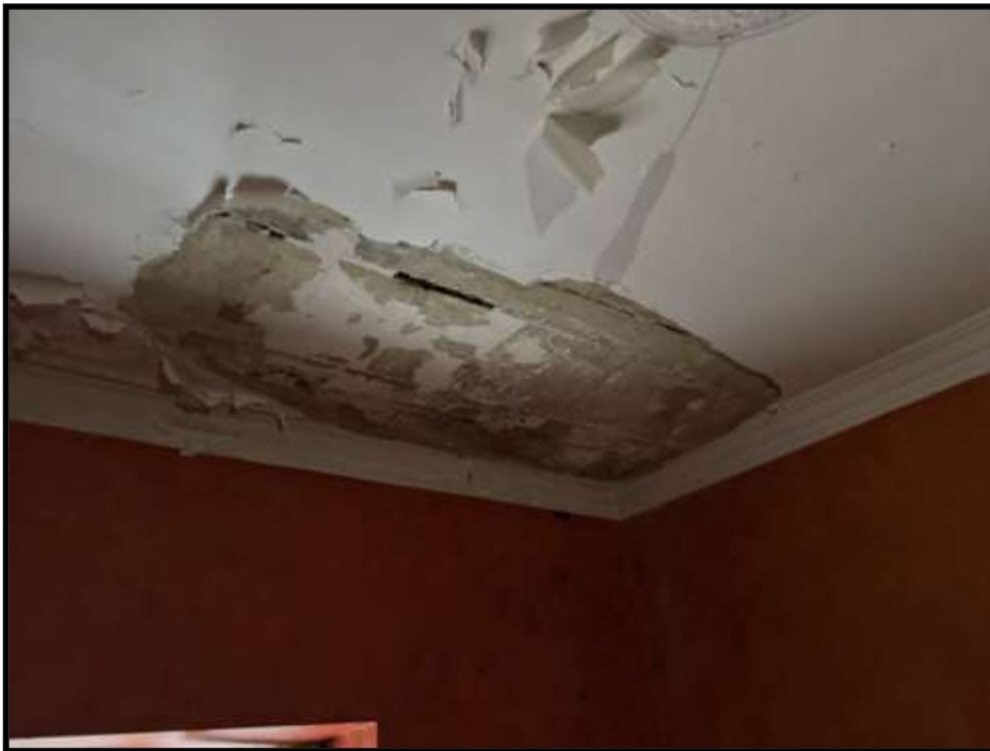
Particolare Distacco intonaco