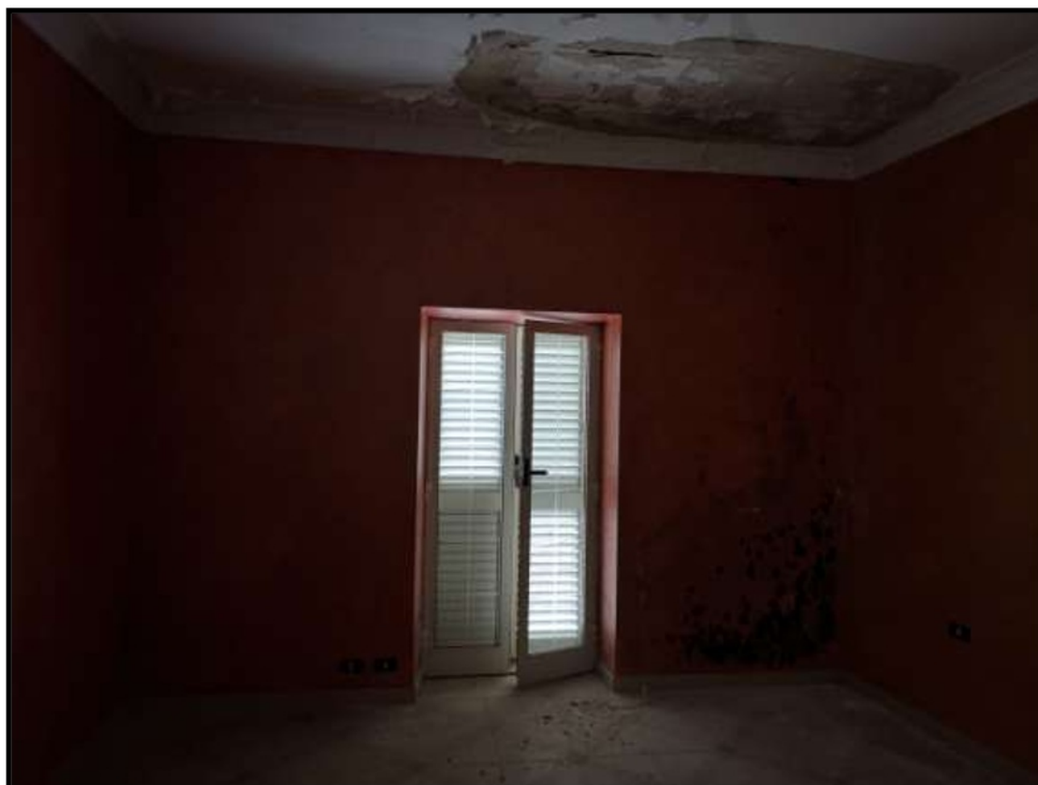
Vano a Piano terra Prospiciente Via Schifani