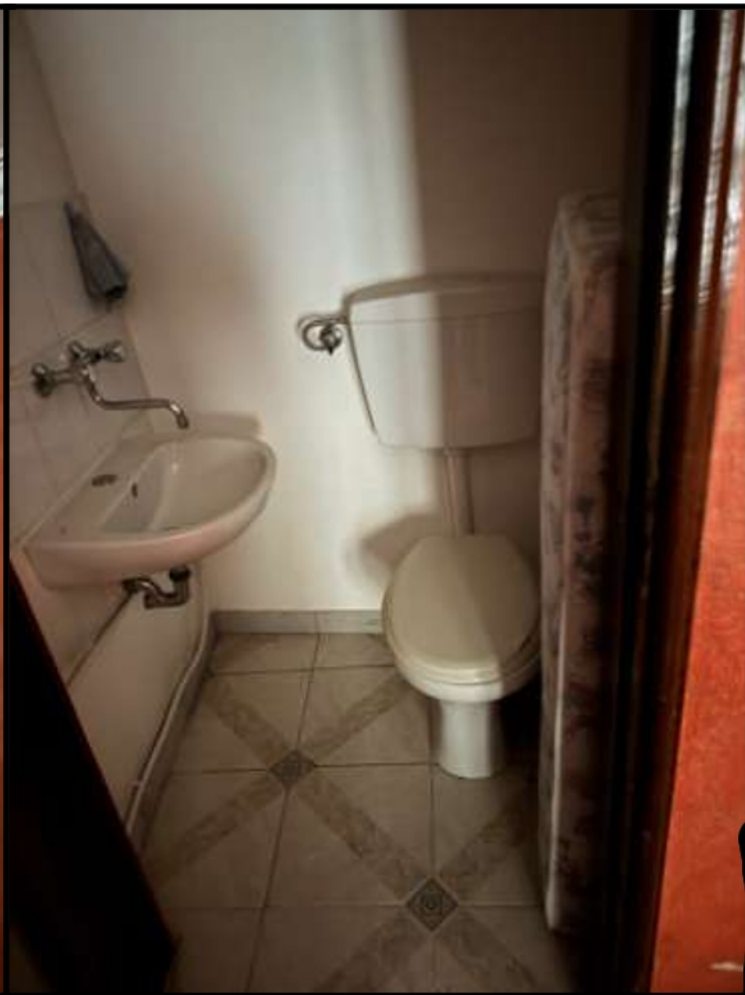
Bagno in Camera