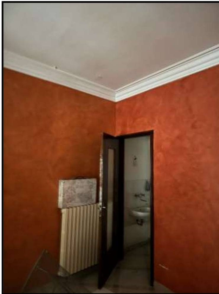
Parete ingresso Bagno in camera