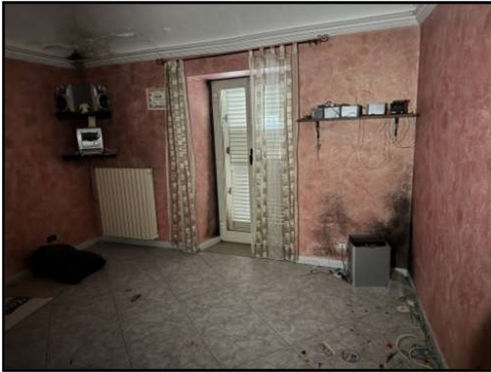
Vano al Piano Primo prospiciente Via Roma