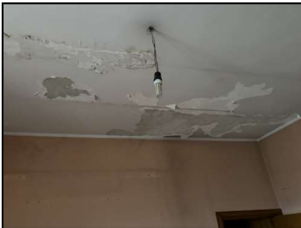
Vano al Piano Primo lato via Schifani – Infiltrazioni dalla copertura