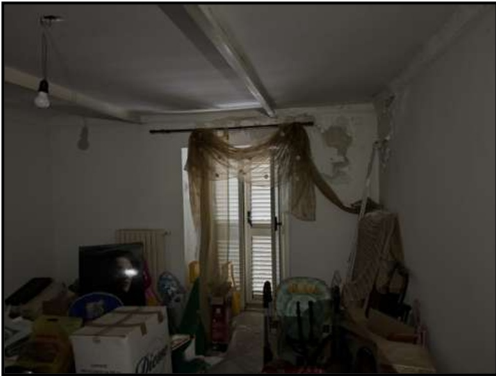
Vano Piano Seminterrato lato via Schifani