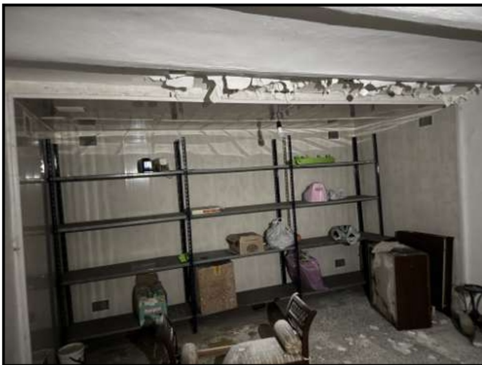
Vano Piano Seminterrato Controterra