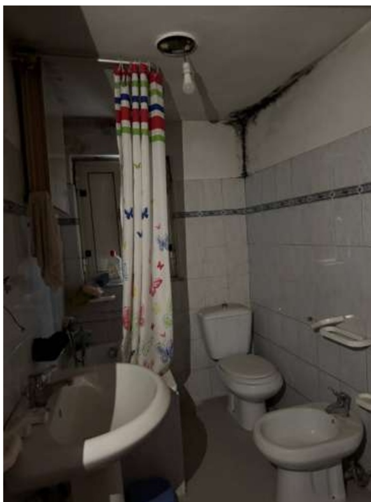
Vano al Piano Primo lato via Schifani – Bagno