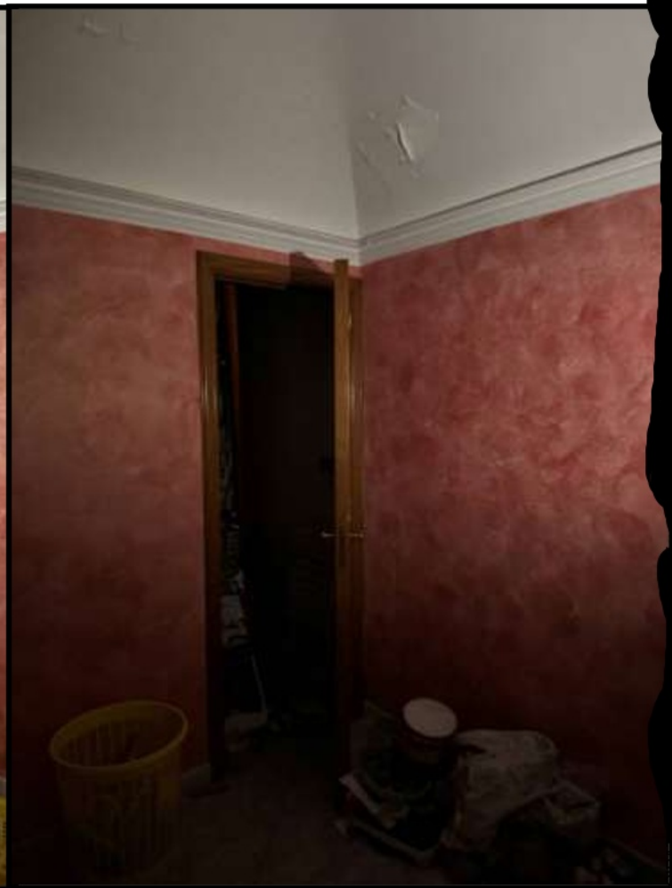
Vano al Piano Primo prospiciente Via Roma