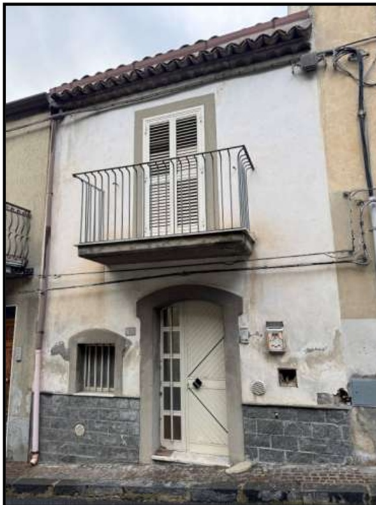
Prospetto Via Roma