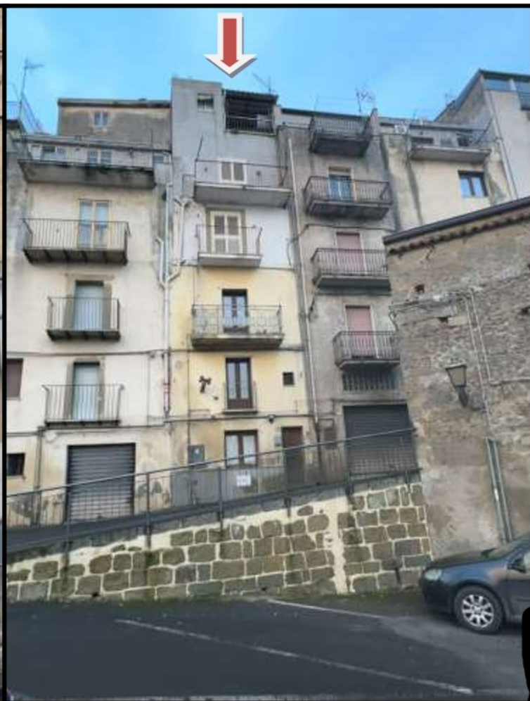
Prospetto via Schifani