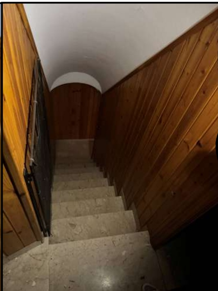
Scala Accesso al Piano Primo