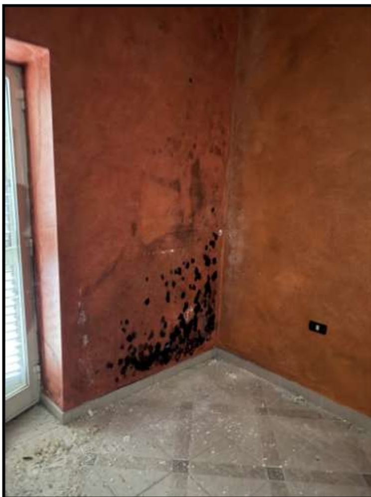
Particolare Muffa Pareti esterne