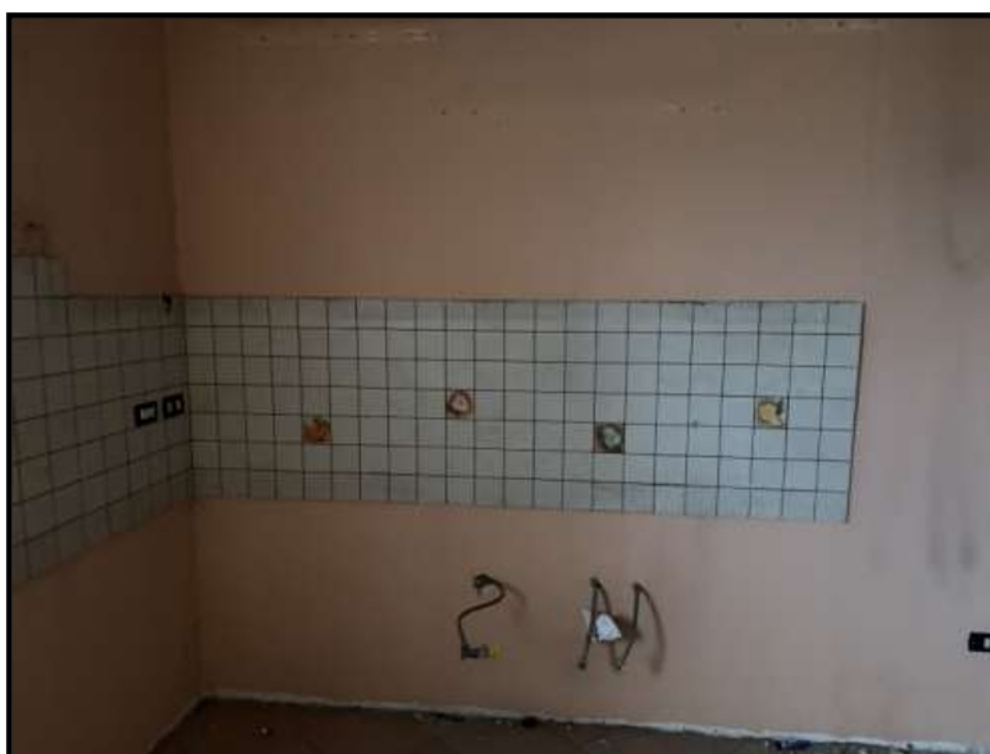
Vano al Piano Primo lato via Schifani – Rivestimento Top Cucina