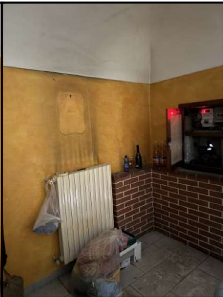
Vano Ingresso Via Roma