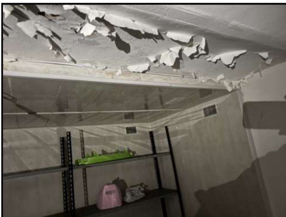
Vano Piano Seminterrato Controterra